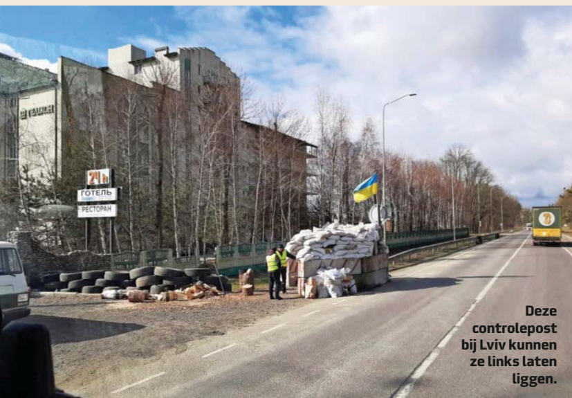
Deze controlepost bij Lviv kunnen ze links laten liggen.