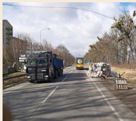
Eenmaal over de grens rij je van wegblokkade naar wegblokkade.