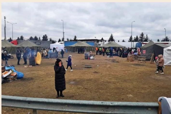
Aan de grens met Polen wachten de vluchtelingen in de bittere kou tot ze verder mogen.