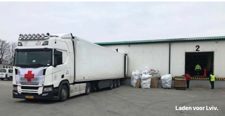
Laden voor Lviv.

Samen rijden we verder, 's nachts nog snel een potje op het vuur.