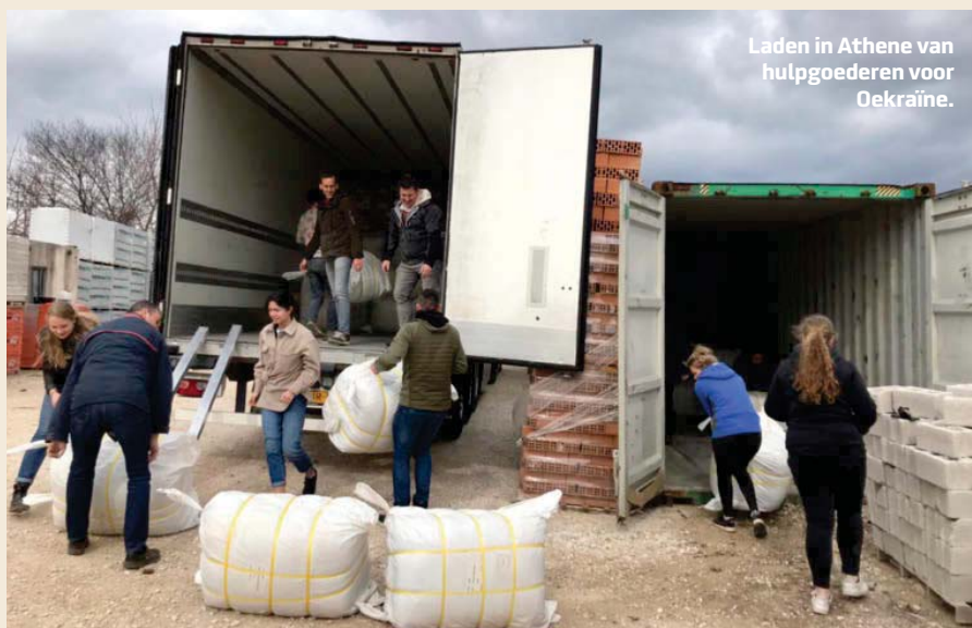
Laden in Athene van hulpgoederen voor Oekraïne.