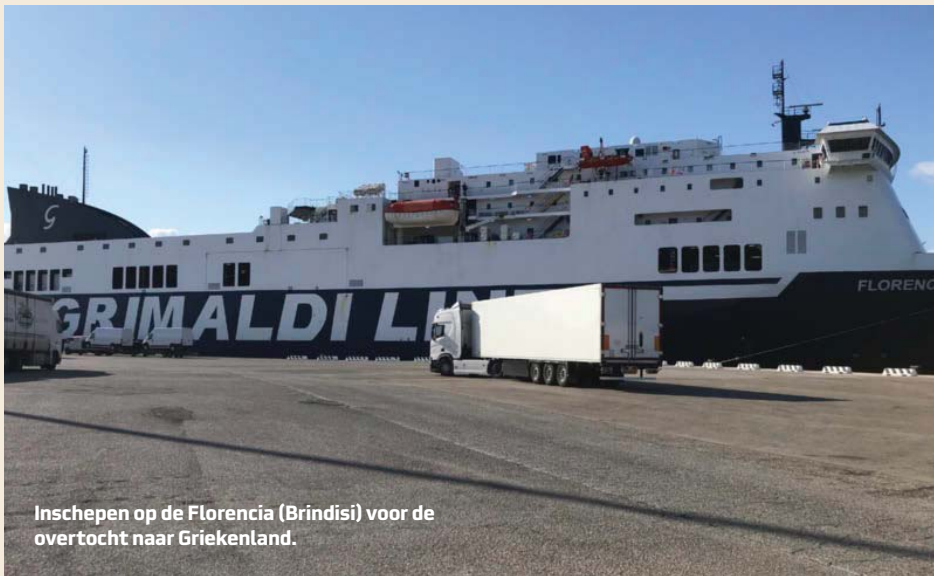
Inschepen op de Florencia (Brindisi) voor de overtocht naar Griekenland.