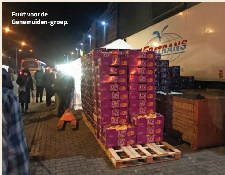
Fruit voor de Genemuiden-groep.