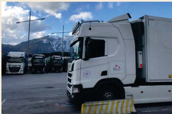
Nog een neveneffect van de oorlog: gestrande Russische trucks met chauffeurs op een parking in Slowakije.