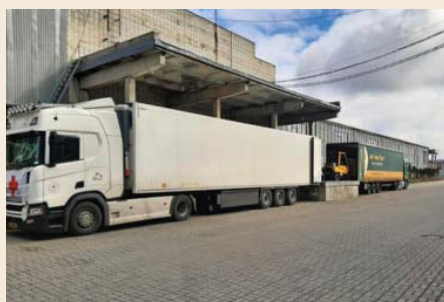
Lossen bij het warehouse in Lviv in Oekraïne.