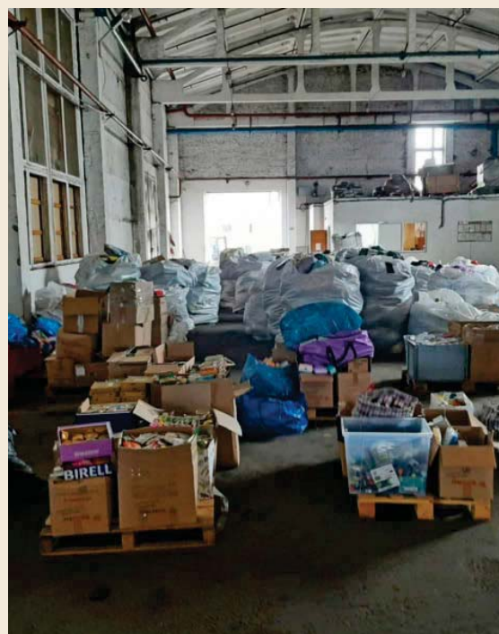
Ontvangst van goederen in het warehouse in het Poolse Przeworsk voor Oekraïne.